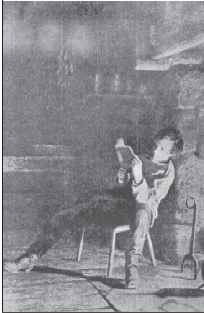
இளமைப் பருவத்தில் 'லிங்கன்'