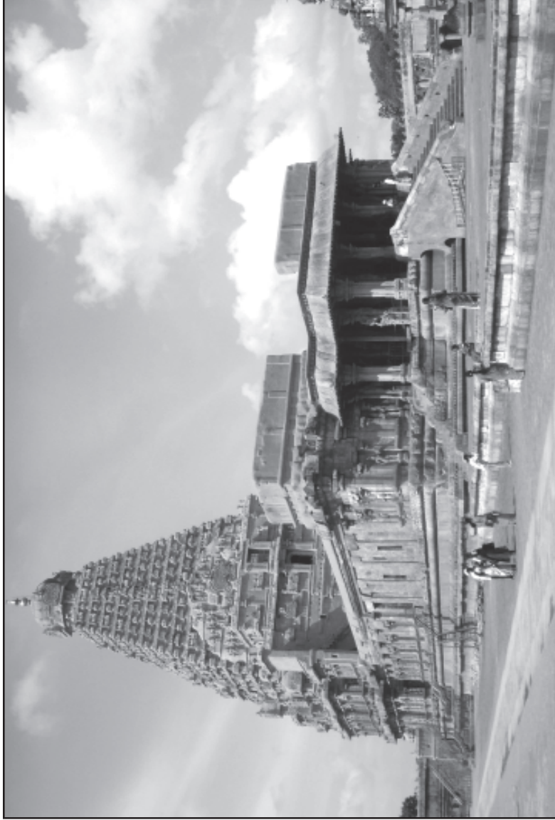
தஞ்சைப் பெரிய கோயில்

காத்து வந்தான்; பிற மதக் கோவில்களுக்குப் பொருள் உதவி செய்தான்; நிலங்களை மானியமாக விட்டான்.