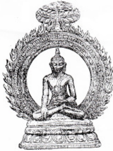
காலத்தில் கண்டெடுக்கப்பட்ட புத்தர்

இவ்விடத்தில் இருந்த மிகப்பழைய இலுப்பை மரம் ஒன்றை ஏசுவின் சபைப் பாதிரிமார் 1856இல் வெட்டியபோது, அம்மரத்தின் அடியில் ஒளித்து வைக்கப்பட்டிருந்த ஐந்து சிறிய பௌத்த விக்கிரகங்களைக் கண்டெடுத்தனர். இவற்றில் நான்கு உலோகத்தினால் ஆனவை; ஒன்று பீங்கானால் செய்யப்பட்டது. இவற்றில் ஒன்று புத்தர் நின்றுகொண்டு உபதேசம் செய்வதுபோல் அமைக்கப்பட்டது. கவர்னராயிருந்த நேப்பியர் பிரபு (Lord Napier) நாகைக்குச் சென்றபோது, பாதிரிமார் இதை அவருக்குக் கொடுத்தார்கள். இந்த விக்கிரகத்தின் பீடத்தில், பதினொன்றாம், அல்லது பன்னிரண்டாம் நூற்றாண்டில் வழங்கிய தமிழ் எழுத்தில், 'ஸ்வஸ்தி ஸ்ரீ ஆகமபண்டிதர் உய்யக் கொண்ட நாயகர்' என்று எழுதப்பட்டிருக்கிறது; இன்னொரு விக்கிரகம் புத்தர் போதியின் கீழ் அமர்ந்து தியானத்தில் இருக்கும் பாவனையாக அமைந்துள்ளது. (படம் 2 - காண்க) இன்னொன்று, புத்தர் இரு கைகளையும் உயர்த்தி அபயம் அளிப்பதுபோல் அமைக்கப்பட்ட உருவம். இன்னொன்று சீன முறைப்படி செய்யப்பட்ட புத்தர் உருவம்.